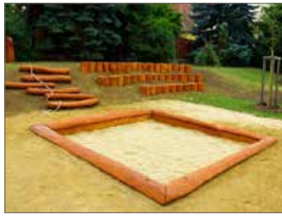
Pískoviště akátové kmeny