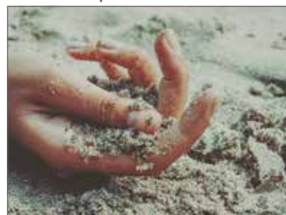
Písek do pískoviště