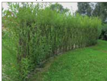
Vrbičkový plot 10 m