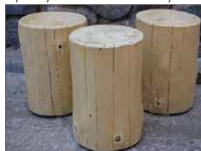
Špalky na sezení 3 kusy