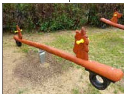
Vahadlová houpačka koniči