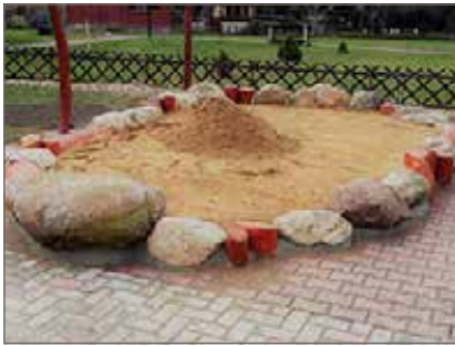
Pískoviště z balvanů