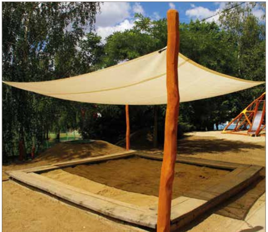
Sluneční a krycí plachta