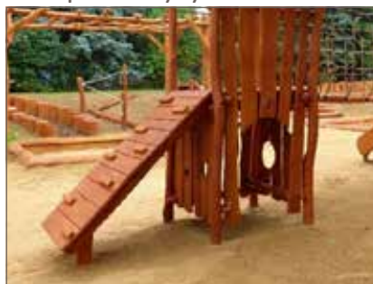
Rampa s chyty