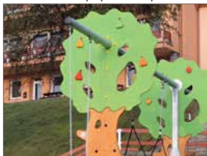
Lezecké chyty k houpačkám