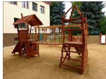
Most s dřevěnými příčkami