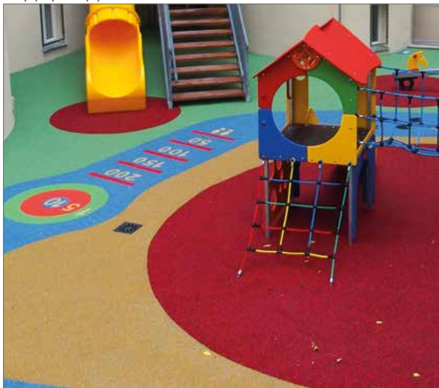
Litý pryžový povrch