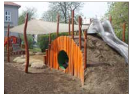
Kopeček s tunýlkem