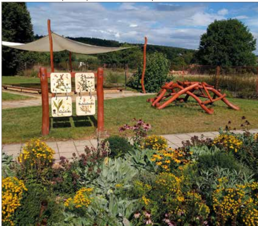
Naučné herní panely - různé motivy