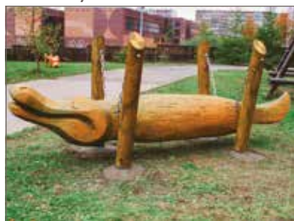
Krokodýl na řetězech