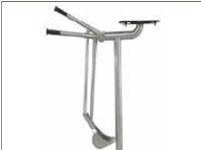
Bagr na písek