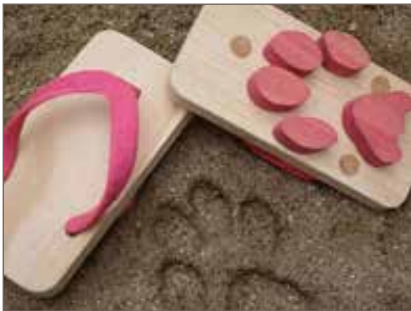
Razítka do písku - stopy