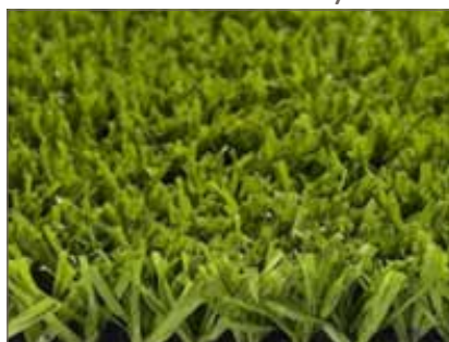
Travní koberec umělý