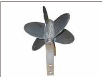
Mlýnek na vodu a písek